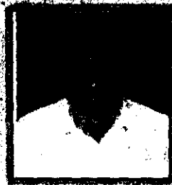
تیلیم کا والد اللہ دیتہ